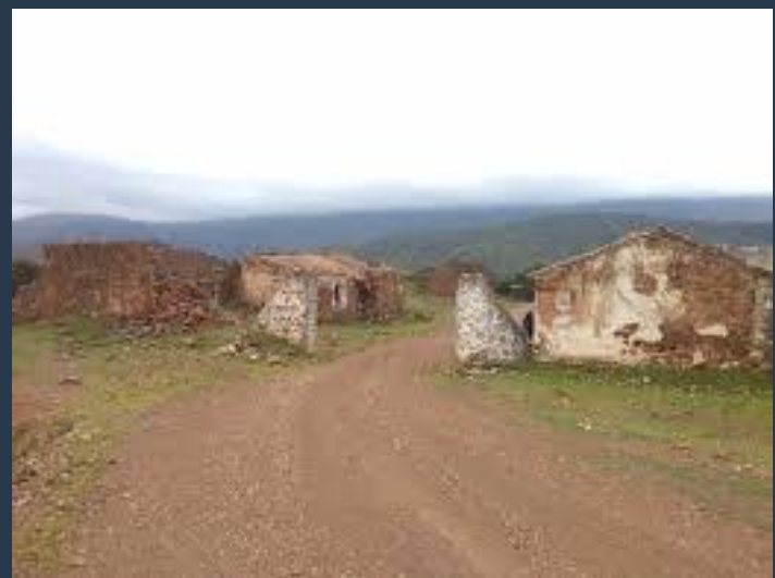
Vista de la aldea de Magaña, hoy en ruinas.

A principios de 1768, las obras en las tres primeras colonias de Sierra Morena se estaban desarrollando a buen ritmo. Por este motivo, el superintendente Pablo de Olavide decidió continuar ampliando el plan de colonización, ocupando los parajes y lugares de Río Rumblar, Carboneros, Navas de Linares, Venta de Linares, Magaña, Aldeaquemada, Venta de Los Santos y Arquillos. Fue así como se decidieron crear nuevos pueblos, entre ellos la aldea de Magaña.